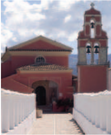
Herrschaftlich: Zugang zur Kirche Teotokos Odegetria

Von der Verbindungsstraße Róda–Sidári geht es – nach der Abzweigung Richtung Karoussádes – rechts auf der Nebenstrecke zur kleinen, östlich von Sidári gelegenen