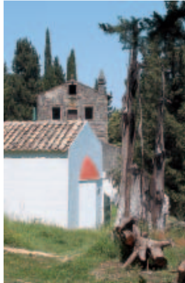
Kloster Pantokrátor von Nímfes

Das Bergdorf am Fuße des Pantokrátors lädt zu einer Rast im Grünen ein. Der große, wunderschöne Dorfplatz mit seinem riesigen, schattenspendenden Ahorn im Zentrum ist ein idealer Picknickplatz: Im großen Rund stehen eiserne Bänke unter Palmen, am öffentlichen Brunnen mit Trinkwasserqualität auf der anderen Straßenseite kann man seine Getränkeflaschen wieder auffüllen. Abends lebt der Platz richtig auf; die zwei Tavernen „Piazza de Nímfes“ und „Green Grillroom“ mit griechischer Küche sind vor allem bei britischen Touristen beliebt.