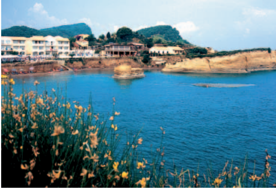
Sidári mit seiner bizarren Küste