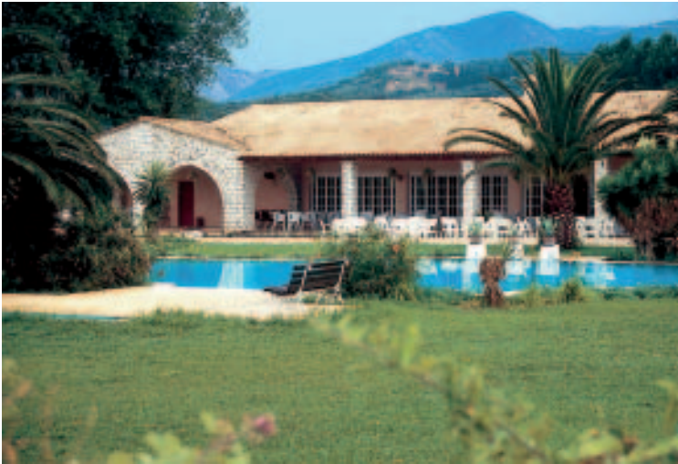
St. George's Country Club in Acharávi