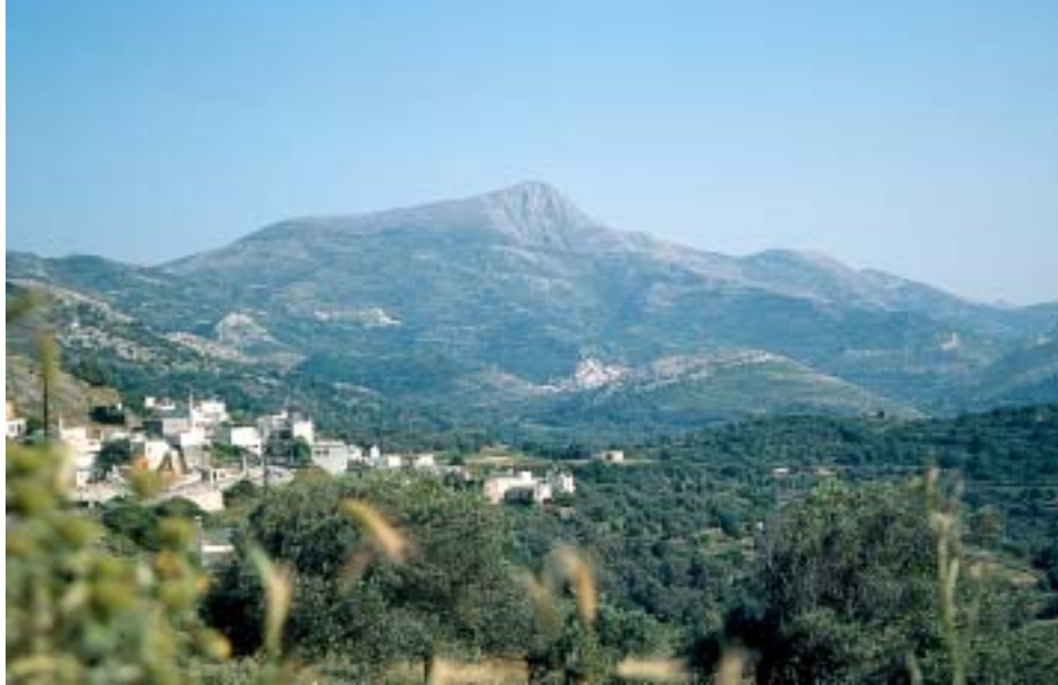
Königlich ragt der Zás über Filóti empor

Wegstrecke: von der Kapelle Agía Marína zunächst südöstlich, hinter einer Bergzunge dann weiter in südwestlicher Richtung über Geröllfelder auf den Gipfel. Der Aufstieg von Agía Marína ist die Ostroute auf den Zás.