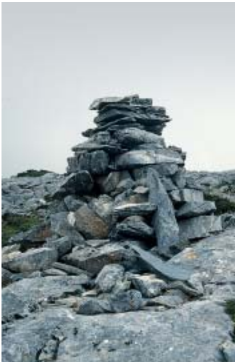
Steinmännchen markieren den Weg auf den Gipfel des Zás

weißes Schildchen mit der Nr. 2), bis man nach etwa 200 m ab der Kapelle zu zwei Häusern kommt. 1999 wurde der Weg auf den Gipfel auch mit kleinen Metalltäfelchen markiert. Der Hohlweg führt weiter zwischen den Häusern hindurch (Punkte auf den Felsplatten am Boden schwer erkennbar). Das erste Gatter nach den Häusern links liegen lassen. Weiter dem Hohlweg folgen, die roten und neuerdings auch grünen Punkte auf dem Boden im Blick. Nach einem zweiten Gatter auf der linken Seite beginnt links ein Metallzaun. Den Hohlweg nicht verlassen. Ungefähr 400 m nach den Häusern trifft man auf ein hölzernes Ziegengatter. Hier keine