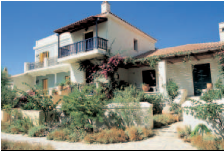
Im alten Stil erbaut: Bungalowdorf „Doryssa Bay“

300.000 Einwohner beherbergt haben. Polykrates selbst scheint ein höchst widersprüchlicher Charakter gewesen zu sein, nicht zimperlich mit seinen Gegnern, gleichzeitig ein großer Förderer der Wissenschaften. Die Beutezüge seiner rasanten, wendigen Kriegsschiffe – heute würde man von Seeräuberei sprechen – versorgten den Tyrannen mit unermesslichen Reichtümern, die seinem Finanzbedarf jedoch immer noch nicht genügten. Polykrates verfiel auf eine Idee, die von heutigen Politikern stammen könnte: Er ließ die Silbermünzen, die damals im Umlauf waren, einziehen, einen bestimmten Anteil des Silbers durch Blei ersetzen und danach die Münzen wieder in den Verkehr bringen.