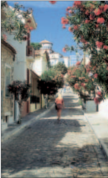
Von Oleander gesäumt: Gasse in Pythagório

Nach der Wiederbesiedelung wurde der Ort wegen der Form der Hafenecke Tigáni getauft, „Bratpfanne“. Ab 1821 geriet Tigáni als Zentrum des Aufstands gegen die Türken noch einmal in den Blickpunkt. Aus jener Zeit stammen die Ruinen der Burg auf dem Kastelhügel. Handel mit Kleinasien brachte dem Städtchen hinfort bescheidenen Wohlstand, der mit der Unterbrechung der Kontakte nach 1922 abrupt zurückging. Seit 1958 trägt das Städtchen seinen heutigen Namen, der an den Mathematiker und Philosophen Pythágoras (siehe im Kapitel zur Inselgeschichte) erinnert, den großen Sohn der Insel. Etwa zwei