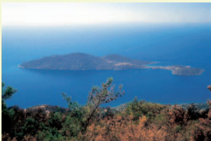
Das „kleine Sámos“ vor der Südküste: Samiopoúla