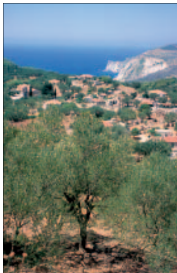
Oberhalb der Westküste liegt das hübsche Kerí

Kerí hat unter dem Erdbeben von 1953 etwas weniger gelitten als andere Inselorte. An einem sanften, dicht mit Olivenbäumen bewachsenen Hang, überragt von zwei etwas über 400 m hohen Berggipfeln (einer heißt übrigens auch Skopós wie sein Pendant auf der anderen Seite der Bucht von Laganás), ziehen sich ziemlich dicht zusammengedrängt die niedrigen Häuser der insgesamt ca. 1000 Bewohner entlang. Den Mittelpunkt bildet eine kleine, von schmalen Gassen umgebene Platía. Vor den Kafepantopolía sitzen die Männer auf einfachen Holzstühlen und lassen gelangweilt die Perlen ihres Kombolóis, ein Kettchen aus Holz-, Kunststoff- oder Glaskugeln, durch die Finger gleiten. Aus den Küchen duftet es verführerisch nach einem deftigen Braten oder einem Gemüseintopf. Am Abend finden auch die Frauen Zeit, den Hocker vors Haus zu stellen und bei einer Handarbeit das Geschehen auf der Straße zu beobachten. Um diese Zeit lohnt es sich schon deshalb umso mehr, weil wegen des Sonnenuntergangs ein paar Fremde im Dorf sind. Wanderfreunde haben Kerí nicht nur als Tagesausflugsziel entdeckt, kann man doch in der reizvollen Umgebung wunderschöne Touren machen.