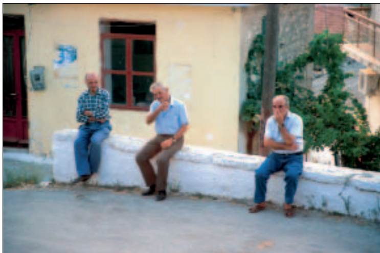
Am Abend trifft man sich gerne auf einen Schwatz

Die meisten Besucher werden aber von den Attraktionen in der Umgebung angezogen. Vom Dorf aus führt eine schmale asphaltierte Straße etwa 1,5 km weit abwärts zum Leuchtturm von Kerí . Den schneeweißen Turm (er ist eingezäunt) kann man zwar nicht begehen, doch ein steiniger Fußpfad führt in ca. 10 Minuten zu einem der schönsten Aussichtspunkte der Insel (s. Wanderung 6 auf S. 211f.). Der Blick über die steil nach unten stürzenden grün bewachsenen Felsen der Westküste ist wirklich grandios. Einen Sonnenuntergang hier zu erleben gehört zu den Highlights eines Zákynthos-Urlaubs.