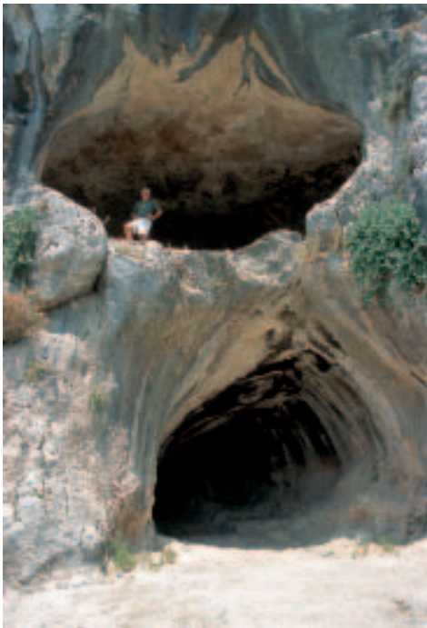
Die doppelstöckige Höhle des Damianós

von wo aus man das allabendliche Versinken der Sonne im Meer genießen kann. Zudem hat man hier eine der traditionellen Vergákia-Hütten (s. S. 205) aufgebaut.