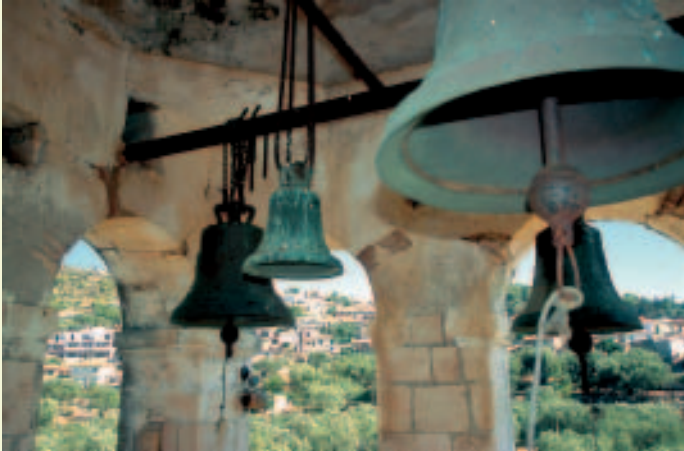
Im prächtigen Glockenturm der Panagia-Kirche

Der gedrungene Glockenturm neben der Kirche kann bestiegen werden – von oben schweift der Blick über das Dorf bis zur Küste hinab.