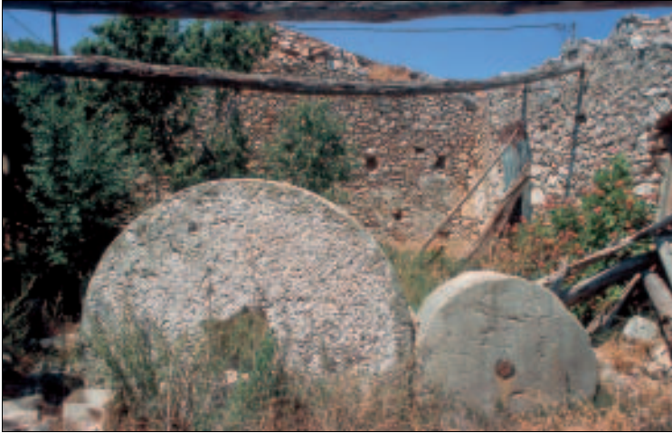
Reste einer alten Ölmühle

Bevor man sich zu den ganz besonders lohnenden Zielen in der Umgebung aufmacht, kann man im Dorf selbst der Art Gallery von Dionýsios Giatrás einen Besuch abstatten. Der Künstler stellt in einem leuchtend blau gestrichenen Gebäude neben der Pfarrkirche Kiría ton Angélon seine Werke aus. Diese zeigen vor allem die typischen Kykladenmotive, aber auch einige surrealistische Bilder sind unter seinen Arbeiten. Dionýsios hat jedoch noch mehr vor: Gegenüber der Kirche will er in einem alten, verfallenen Gebäude eine mehr als 100 Jahre alte Ölmühle restaurieren und Besuchern zugänglich machen. Zudem beabsichtigt er, ein Heimatmuseum einzurichten. Mehr als die Hinweisschilder war bei unserem letzten Besuch allerdings noch nicht zu entdecken.