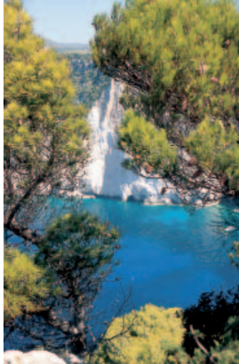
Panorama am Kap Kerí

Das Bergland hat immer noch relativ viel unbesiedelte Naturlandschaft zu bieten und ist auf der Insel das beste Gebiet für Spaziergänge und Wanderungen, auch wenn man manchmal auf betonierten Wegen gehen muss. Lohnende Ziele sind neben den schönen Dörfern z. T. verlassene, einsam gelegene Klöster, eine Karsthöhle oder auch der mit 756 m höchste Gipfel des Vrachionas-Gebirges, Vouní genannt. Schließlich gehören die ins Meer hinabstürzenden weißen Felsen der Küste zum Schönsten und Spektakulärsten, was Zákynthos zu bieten hat. Nicht nur der Shipwreck-Beach, eines der bekanntesten Postkartenmotive in Griechenland über-